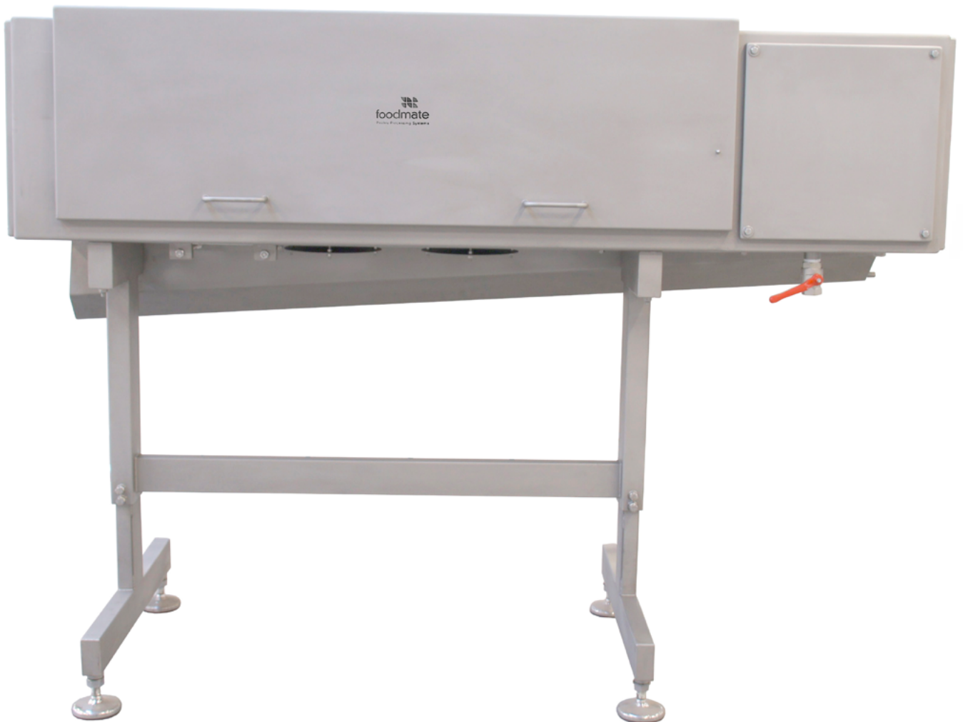
table d'inspection, une laveuse, une dégraisseuse et un dispositif de refroidissement sur une ligne de production.

Cet équipement permet de séparer gésiers de volailles de la grappe intestinale, de nettoyer les gésiers et d'enlever la peau. Il est possible de combiner cette machine à gésiers avec un convoyeur à vis, une